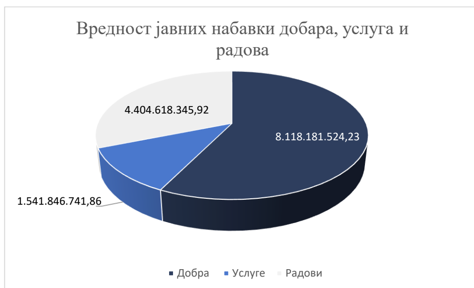
Графикон број 4: Приказ спроведених јавних набавки према предмету јавне набавке

Друштво је у 2018. и 2019. години доставило Управи за јавне набавке кварталне извештаје; Образац А за евидентирање података о закљученим уговорима у поступцима јавних набавки (осим у поступку јавних набавки мале вредности) и Образац Б за евидентирање података о закљученим уговорима у поступку јавне набавке мале вредности